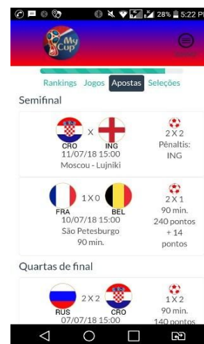
Figura 5. Uma das interfaces construídas.

desenvolvimento Web foi atribuída a construção da parte servidora (do inglês server-side ) responsável pelo cadastro de informações no sistema, tais como: seleções, grupos de seleções e jogos, lançamento dos resultados dos jogos, tão logo realizados, em um ambiente seguro por senhas e seções, restrito a alguns usuários administrativos do software. O desenvolvimento Mobile recebeu como incumbência a programação da parte cliente (do inglês client-side ) que faria acessos controlados ao banco de dados, executando gravações e recuperações de dados, apresentando-os na interface gráfica do aplicativo e fazendo uso de APIs (Interface de Programação entre Aplicações, do inglês Application Programming Interface ). A Figura 5 apresenta uma interface do aplicativo produzido.